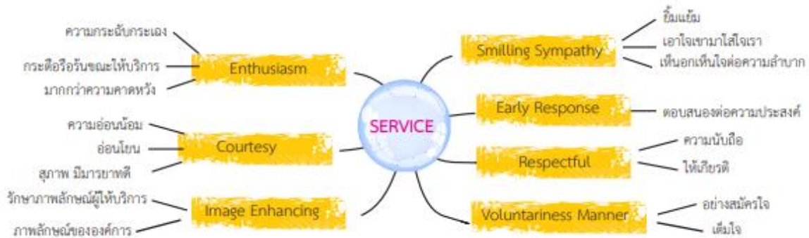
ภาพที่ 1.1 แสดงความหมายอักษร SERVICE

สรุปได้ว่า การบริการหมายถึงงานที่ปฏิบัติรับใช้ หรืองานที่ให้ความสะดวกต่างๆเกิดจากการปฏิสัมพันธ์ระหว่างผู้ที่ต้องการใช้บริการกับผู้ให้บริการ ในรูปแบบกิจกรรมผลประโยชน์หรือความพึงพอใจที่ผู้ขายจัดทำขึ้น เพื่อสนองความต้องการแก่ผู้บริโภค และเพื่อส่งเสริมการขายให้มีประสิทธิภาพ