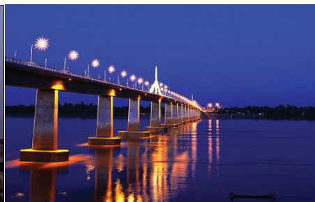
จังหวัดมุกดาหารเข้ากับแขวงสะหวันนะเขต