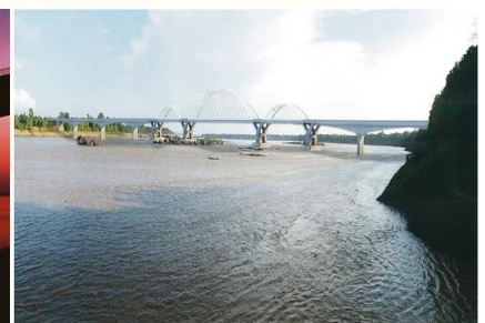
จังหวัดอุบลราชธานี เข้ากับเมืองละคอนห่ง