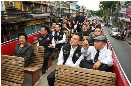
รูป 4 การท่องเที่ยวเชิงธุรกิจ

4) วัตถุประสงค์และรูปแบบการท่องเที่ยวที่มีความหลากหลายมากขึ้น การเดินทางท่องเที่ยวระหว่างประเทศมีวัตถุประสงค์หลากหลายมากขึ้น เนื่องจากการเปิดเสรีทำให้มีการเดินทางด้วยวัตถุประสงค์ทางธุรกิจมากขึ้น เช่น การเดินทางเพื่อเข้าร่วมงานแสดงสินค้า ดูงาน การเดินทางเพื่อติดต่อธุรกิจ เสนอขายสินค้า การเดินทางเข้ามาศึกษาตลาด (ท่องเที่ยวเชิงธุรกิจ) การเดินทางเข้ามาซื้อสินค้าหรือรับบริการธุรกิจ เป็นต้น นอกจากนี้การติดต่อสื่อสารและการเดินทางข้ามประเทศที่สะดวกขึ้นและมีต้นทุนที่ต่ำลง จะทำให้การดำเนินทางเพื่อเข้ามาใช้บริการข้ามประเทศมากขึ้น เช่น การเข้ามาใช้บริการทางการแพทย์ การทำศัลยกรรม การเดินทางเข้ามาฝึกอบรมหลักสูตรระยะสั้น หรือศึกษาต่อ การเดินทางเพื่อรับบริการดูแลผู้สูงอายุ (เนื่องจากโลกเข้าสู่สังคมผู้สูงอายุ)