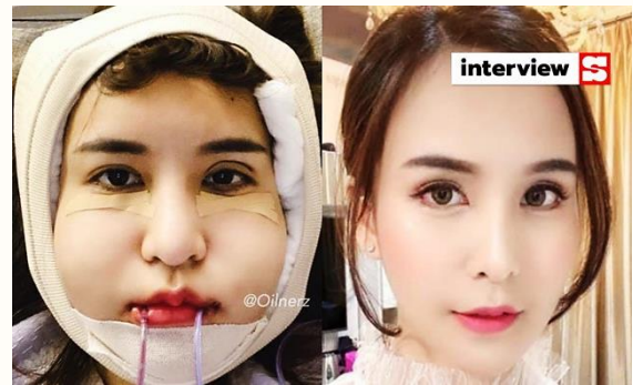
รูป 5 การท่องเที่ยวเพื่อการทำศัลยกรรม

5) การท่องเที่ยวส่วนบุคคลขยายตัวมากขึ้น การพัฒนาเทคโนโลยีสารสนเทศ ทำให้คนทั่วโลกเข้าถึงข้อมูลการท่องเที่ยวมากขึ้น ประกอบกับเครือข่ายสังคม (Social network) ยังมีส่วนในการเผยแพร่ข้อมูลข่าวสารด้านการท่องเที่ยว มีการแบ่งปันข้อมูลจากประสบการณ์การเดินทางไปท่องเที่ยวในที่ต่างๆ สามารถเข้าไปดูแผนที่ หรือภาพถ่ายของเส้นทางการเดินทาง (street view) การพัฒนาเส้นทางคมนาคมระหว่างประเทศและความสะดวกในการข้ามแดน จะทำให้เกิดบริการขนส่งสาธารณะระหว่างประเทศมากขึ้น ทำให้การท่องเที่ยวระหว่างประเทศในลักษณะการท่องเที่ยวส่วนบุคคลเพิ่มมากขึ้น และมีการเดินทางท่องเที่ยวระหว่างประเทศด้วยรถยนต์และระบบรางมากขึ้น ซึ่งเหมือนกับการท่องเที่ยวของคนในประเทศที่ไม่นิยมท่องเที่ยวแบบเป็นกลุ่มใหญ่ (group tour)