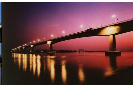
จังหวัดบึงกาฬเข้ากับเมืองปากซัน แขวงบอลิคำไซ