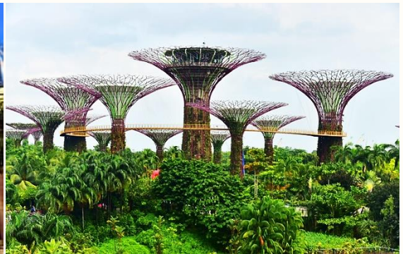
รูป 2 สวนพฤกษศาสตร์ “Garden by the bay” ที่สิงคโปร์

3) บริการท่องเที่ยวในภูมิภาคมีความเชื่อมโยงกันมากขึ้น การท่องเที่ยวในภูมิภาคอาเซียนมีแนวโน้มเชื่อมโยงกันมากขึ้น เนื่องจากประชาคมเศรษฐกิจอาเซียนมีความร่วมมือในการส่งเสริมการท่องเที่ยวในภูมิภาค โดยเฉพาะการลดข้อจำกัดในการเคลื่อนย้ายนักท่องเที่ยวในภูมิภาค การพัฒนาโครงสร้างพื้นฐานด้านคมนาคมเชื่อมโยงระหว่างประเทศ ข้อตกลงเหล่านี้มีผลทำให้บริการการท่องเที่ยวในอาเซียนมีแนวโน้มเป็นบริการระดับภูมิภาคมากขึ้น ในอนาคตธุรกิจท่องเที่ยวไทยจะต้องสร้างเครือข่ายการให้บริการร่วมกับธุรกิจท่องเที่ยวในต่างประเทศ หรือการเข้าไปลงทุนหรือตั้งสำนักงานในประเทศเพื่อนบ้าน เพื่อสามารถให้บริการนักท่องเที่ยวได้อย่างครบวงจร และให้บริการนักท่องเที่ยวที่มีความต้องการเดินทางท่องเที่ยวหลายประเทศได้ดียิ่งขึ้น