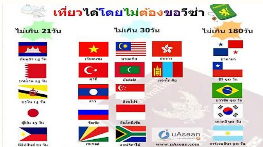
รูป 1 การท่องเที่ยวโดยไม่ต้องขอ Visa

1) การขยายตัวของจำนวนนักท่องเที่ยวโลกาภิวัตน์ จะทำให้เกิดการขยายตัวของการท่องเที่ยวมากขึ้นเช่นเดียวกับ ประชาคมเศรษฐกิจอาเซียนจะนำไปสู่การลดข้อจำกัดในการเคลื่อนย้ายของนักท่องเที่ยว เช่น การออกวีซ่า ASEAN (วีซ่าเดียวเข้าได้ทุกประเทศในอาเซียน) การปรับปรุงระเบียบพิธีการด้านการออกใบอนุญาตเข้าเมือง และการตรวจคนเข้าเมืองให้เป็นมาตรฐานเดียวกันทั้งภูมิภาค ทำให้จำนวนนักท่องเที่ยวที่เดินทางมาท่องเที่ยวในประเทศไทยจะขยายตัวสูงขึ้น ซึ่งทั้งภูมิภาคนี้มีประชากรรวมกันมากกว่า 600 ล้านคน โดยเฉพาะนักท่องเที่ยวจากอินโดนีเซียที่มีประชากรถึง 240 ล้านคน หากมีการก่อสร้างสะพานเชื่อมระหว่างสิงคโปร์กับอินโดนีเซีย จะทำให้นักท่องเที่ยวอินโดนีเซียเข้ามายังประเทศไทยมากขึ้น ประเทศไทยยังมีโอกาสต้อนรับนักท่องเที่ยวจากภูมิภาคอาเซียนมากขึ้น เนื่องจากไทยตั้งอยู่ศูนย์กลางของภูมิภาค มีพรมแดนติดกับประเทศเพื่อนบ้านมากที่สุดในภูมิภาค