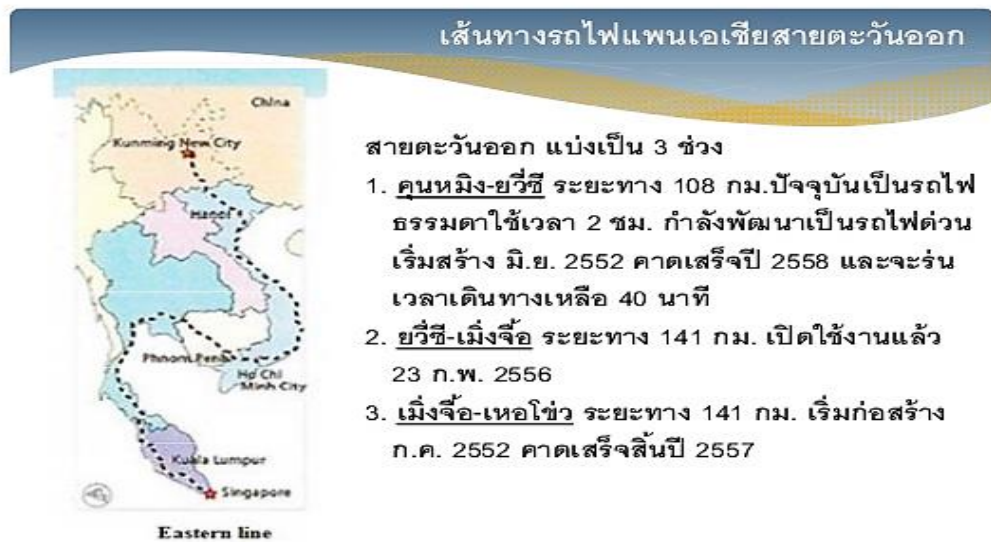
รูป 7 โครงการพัฒนาเส้นทางรถไฟแพนเอเชียจำนวน 3 เส้นทาง

6) การพัฒนาและสร้างเส้นทางและแหล่งท่องเที่ยวใหม่ๆ การสร้างเส้นทางคมนาคมข้ามประเทศทำให้เกิดเส้นทางและแหล่งท่องเที่ยวใหม่ๆ เช่น โครงการพัฒนาเส้นทางรถไฟแพนเอเชียจำนวน 3 เส้นทางเชื่อมโยงระบบรางระหว่างนครคุนหมิงกับประเทศต่างๆ ในอาเซียน กล่าวคือ ผ่านเมียนมาร์ ลาว เวียดนามและกัมพูชา เส้นทางรถไฟจะเชื่อมโยงกับเส้นทางรถไฟในประเทศไทยและเชื่อมโยงไปยังมาเลเซียและสิงคโปร์ หรือแนวพื้นที่พัฒนาเศรษฐกิจตามโครงการเส้นทางระเบียงเศรษฐกิจ ไม่ว่าจะเป็นระเบียงเศรษฐกิจแนวตะวันออก-ตะวันตก (East-West Economic Corridor) ระเบียงเศรษฐกิจแนวเหนือ-ใต้ (North-South Economic Corridor) หรือระเบียงเศรษฐกิจแนวใต้ (Southern Economic Corridor) พื้นที่ตามแนวเส้นทางเหล่านี้จะได้รับการพัฒนาให้เป็นแหล่งท่องเที่ยวใหม่ โดยเฉพาะพื้นที่บริเวณชายแดนมีโอกาสสูงที่จะได้รับการพัฒนาเป็นแหล่งท่องเที่ยวใหม่