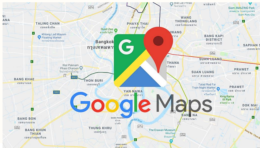
รูป 6 Google Map ใช้ในการนำทางแหล่งท่องเที่ยว

5) การท่องเที่ยวส่วนบุคคลขยายตัวมากขึ้น การพัฒนาเทคโนโลยีสารสนเทศ ทำให้คนทั่วโลกเข้าถึงข้อมูลการท่องเที่ยวมากขึ้น ประกอบกับเครือข่ายสังคม (Social network) ยังมีส่วนในการเผยแพร่ข้อมูลข่าวสารด้านการท่องเที่ยว มีการแบ่งปันข้อมูลจากประสบการณ์การเดินทางไปท่องเที่ยวในที่ต่างๆ สามารถเข้าไปดูแผนที่ หรือภาพถ่ายของเส้นทางการเดินทาง (street view) การพัฒนาเส้นทางคมนาคมระหว่างประเทศและความสะดวกในการข้ามแดน จะทำให้เกิดบริการขนส่งสาธารณะระหว่างประเทศมากขึ้น ทำให้การท่องเที่ยวระหว่างประเทศในลักษณะการท่องเที่ยวส่วนบุคคลเพิ่มมากขึ้น และมีการเดินทางท่องเที่ยวระหว่างประเทศด้วยรถยนต์และระบบรางมากขึ้น ซึ่งเหมือนกับการท่องเที่ยวของคนในประเทศที่ไม่นิยมท่องเที่ยวแบบเป็นกลุ่มใหญ่ (group tour)