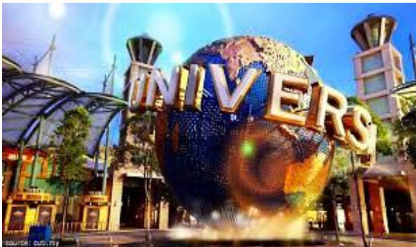
รูป 2 สตูดิโอของยูนิเวอร์ซอล (Universal Studio) ที่สิงคโปร์

ที่พยายามใช้กลยุทธ์พัฒนาแหล่งท่องเที่ยวที่มีมนุษย์สร้างขึ้น เช่น สตูดิโอของยูนิเวอร์ซอล (Universal Studio) สวนพฤกษศาสตร์ “Garden by the bay” การจัดแข่งขันรถสูตรหนึ่ง (Formula one) การดึงดูดการประชุมสัมมนา และแสดงสินค้า และการส่งเสริมการท่องเที่ยวเชิงสุขภาพระดับ High End เป็นต้น โดยสิงคโปร์มีความได้เปรียบจากความเป็นศูนย์กลางการคมนาคมทางอากาศและทางน้ำ การเป็นศูนย์กลางการเงินในภูมิภาค การมีสำนักงานสาขาของต่างชาติมาตั้งอยู่จำนวนมาก และการมีสถาบันการศึกษาที่มีคุณภาพในระดับนานาชาติ นอกจากนี้สิงคโปร์แล้ว ไทยยังมีคู่แข่งสำคัญอีกประเทศหนึ่งคือมาเลเซีย ซึ่งมีกลยุทธ์คล้ายคลึงกับสิงคโปร์ นอกจากนี้การเปิดเสรีด้านการบริการและการลงทุนจะทำให้ธุรกิจท่องเที่ยวไทยต้องแข่งขันกับธุรกิจต่างชาติมากขึ้น และทำให้ธุรกิจท่องเที่ยวในประเทศไทยมีต่างชาติเป็นเจ้าของมากขึ้นด้วย