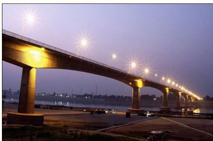
จังหวัดหนองคายเข้ากับกรุงเทพฯ เชียงใหม่

3) บริการท่องเที่ยวในภูมิภาคมีความเชื่อมโยงกันมากขึ้น การท่องเที่ยวในภูมิภาคอาเซียนมีแนวโน้มเชื่อมโยงกันมากขึ้น เนื่องจากประชาคมเศรษฐกิจอาเซียนมีความร่วมมือในการส่งเสริมการท่องเที่ยวในภูมิภาค โดยเฉพาะการลดข้อจำกัดในการเคลื่อนย้ายนักท่องเที่ยวในภูมิภาค การพัฒนาโครงสร้างพื้นฐานด้านคมนาคมเชื่อมโยงระหว่างประเทศ ข้อตกลงเหล่านี้มีผลทำให้บริการการท่องเที่ยวในอาเซียนมีแนวโน้มเป็นบริการระดับภูมิภาคมากขึ้น ในอนาคตธุรกิจท่องเที่ยวไทยจะต้องสร้างเครือข่ายการให้บริการร่วมกับธุรกิจท่องเที่ยวในต่างประเทศ หรือการเข้าไปลงทุนหรือตั้งสำนักงานในประเทศเพื่อนบ้าน เพื่อสามารถให้บริการนักท่องเที่ยวได้อย่างครบวงจร และให้บริการนักท่องเที่ยวที่มีความต้องการเดินทางท่องเที่ยวหลายประเทศได้ดียิ่งขึ้น