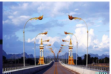
จังหวัดนครพนมเข้ากับเมืองท่าแขก แขวงคำม่วน