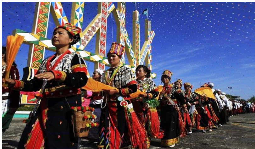
ภาพ นักท่องเที่ยวที่เป็นชนกลุ่มน้อยหรือชาติพันธุ์ต่างๆ

ความเป็นชนกลุ่มน้อยซึ่งมีอยู่มากมายในโลกนี้และมีให้เห็นในหลายๆ ประเทศ บางกลุ่มอาจตั้งรกรากในประเทศที่อยู่อาศัยเป็นเวลานานหลายชั่วอายุคน บางกลุ่มอาจย้ายถิ่นฐานไปตั้งรกรากในประเทศเพื่อนบ้านใกล้เคียง เช่น ในภาคเหนือของไทยมีกลุ่มชาติพันธุ์มากมายที่มาตั้งรกรากอาศัยอยู่เป็นเวลานาน ทั้งชนชาติไท ลื้อ กะเหรี่ยง จีนฮ่อ ฯลฯ อย่างไรก็ตามแม้แต่ในประเทศที่พัฒนาแล้วยังมีกลุ่มนักท่องเที่ยวที่เป็นชนกลุ่มน้อย (Ethnic Minority Tourists) เหล่านี้ ชื่อรายการนำเที่ยวแบบเหมาจ่ายหรือที่เรียกว่า Package Tour ในการเดินทางท่องเที่ยว ซึ่งนักท่องเที่ยวกลุ่มนี้มักจะเดินทางไปเยี่ยมญาติมากกว่าเหตุผลอื่น และปัจจุบันนักท่องเที่ยวชนกลุ่มน้อยนี้ได้ขยายตัวเพิ่มมากขึ้น และหันมาสนใจการท่องเที่ยวในประเทศอื่นมากขึ้นเพื่อเปิดโลกทัศน์ให้กับตัวเอง จึงยังคงต้องคอยติดตามต่อไปว่าชนกลุ่มน้อยในประเทศต่างๆ จะมีความเป็นอยู่ที่ดีขึ้นและอาจกลายเป็นนักท่องเที่ยวอีกกลุ่มที่สำคัญในตลาดท่องเที่ยวต่อไป