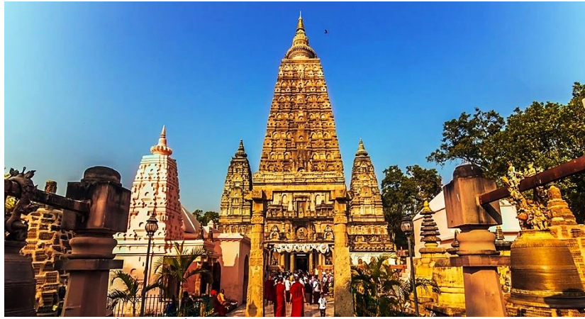
ภาพ การเดินทางเพื่อแสวงบุญที่พุทธคยา ประเทศอินเดีย

ความงามของสถาปัตยกรรม หรือเข้าไปพักผ่อนสงบจิตใจ เช่น หาเวลาว่างไปปฏิบัติธรรมในสถานธรรม สำนักปฏิบัติธรรมหรือวัดวาอารามกันมากขึ้น ทุกศาสนา พุทธ คริสต์ อิสลามหรือมุสลิมต่างต้องการแหล่งยึดเหนี่ยวจิตใจ จึงมักเดินทางไปยังสถานที่นั้นๆ เช่น มัสยิดหรือวัด ในการปรับและพัฒนาสภาพจิตใจให้ดีขึ้น