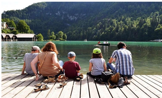
ภาพ นักท่องเที่ยวที่เดินทางท่องเที่ยวเป็นครอบครัว

9.4 ช่วงเด็กวัยรุ่น หมายถึงเด็กที่มีอายุตั้งแต่ 13-18 ปี เป็นช่วงที่เด็กต้องการมีกิจกรรมเป็นของตนเอง โดยเป็นกิจกรรมที่คล้ายกับผู้ใหญ่มากขึ้น