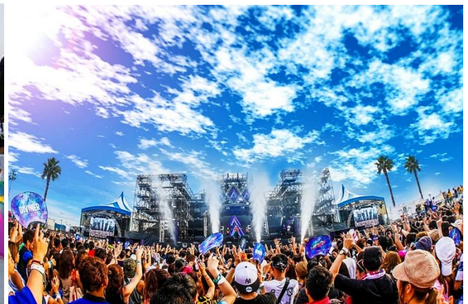
ภาพ งานเทศกาลดนตรี