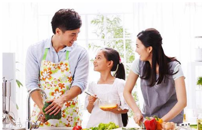
ภาพ นักท่องเที่ยวแบบทำอาหารเอง

นักท่องเที่ยวแบบทำอาหารเอง (Self-catering Holidays) นักท่องเที่ยวกลุ่มนี้เป็นอีกรูปแบบหนึ่ง ที่ต้องการลดค่าใช้จ่ายในการท่องเที่ยว แต่อีกเหตุผลหนึ่งของการท่องเที่ยวในรูปแบบนี้ คือต้องการความเป็นอิสระในเรื่องอาหาร ช่วงเวลาในการทานอาหารหรือมารยาทต่างๆ ในการรับประทานอาหาร ซึ่งอาจดูเป็นเรื่องยุ่งยากและเป็นทางการมากหากเป็นการทานอาหารที่โรงแรม จึงอยากจะทำอาหารรับประทานเองในกลุ่ม ซึ่งนักท่องเที่ยวกลุ่มนี้อาจมาในรูปแบบของกลุ่มครอบครัว กลุ่มเพื่อนหรือกลุ่มองค์กร หน่วยงานต่างๆ ก็ได้