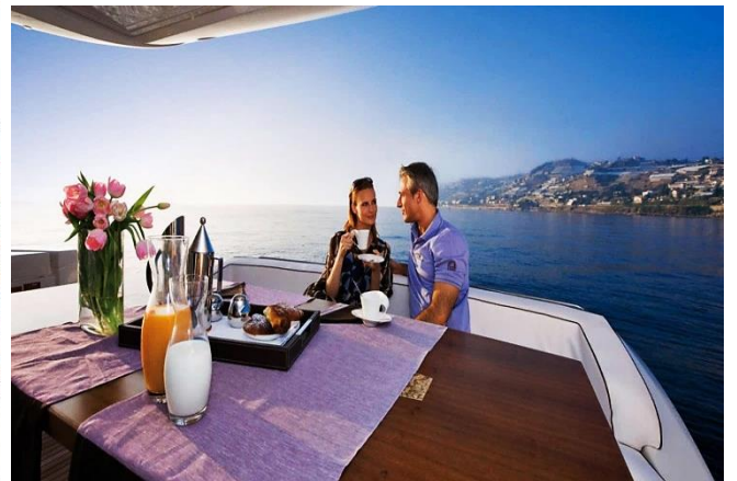
ภาพ รับประทานอาหารบนเรือล่องไปตามทะเล