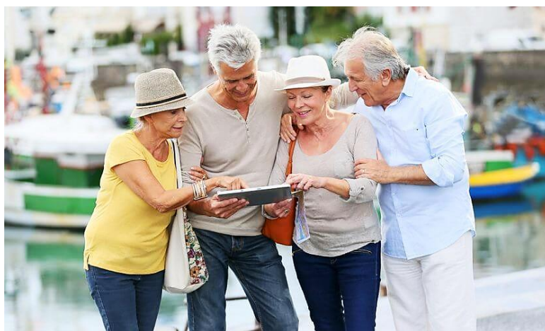
ภาพ นักท่องเที่ยวกลุ่มผู้สูงอายุ

นักท่องเที่ยวกลุ่มผู้สูงอายุ (Elderly Tourists) โดยทั่วไปจะมีจุดประสงค์ในการเดินทาง คือเพื่อการพักผ่อน เยี่ยมเพื่อน เยี่ยมญาติมิตรหรือศึกษาหาความรู้ในสิ่งแปลกใหม่ และมีเวลาว่างสำหรับการท่องเที่ยว ศึกษาในเชิงลึก กลุ่มผู้สูงอายุนับเป็นหนึ่งในสามของนักท่องเที่ยวของแหล่งท่องเที่ยวทางประวัติศาสตร์และวัฒนธรรม โดยจะให้ความสำคัญกับอาหารในระหว่างการท่องเที่ยว ไม่ค่อยสนใจการเที่ยวกลางคืน มักใช้พาหนะเพื่อการท่องเที่ยวโดยเฉพาะในการตัดสินใจเดินทางท่องเที่ยวของนักท่องเที่ยวในวัยกลางคนและผู้สูงอายุจะมีความแตกต่างจากนักท่องเที่ยววัยหนุ่มสาวในหลายๆ ด้าน เช่น อิทธิพลจากกลุ่มเพื่อนลดลง มีความเป็นวัตถุนิยมน้อยลง มีความเป็นส่วนตัว มีเงินใช้จ่าย และมีความรอบคอบมากขึ้น เป็นตัวของตัวเอง ไม่สนใจเรื่องราคามากนัก ค่านิยมเปลี่ยนไป ฯลฯ แต่กลุ่มนักท่องเที่ยวผู้สูงอายุนี้เป็นกลุ่มที่สร้างรายได้ให้กับการท่องเที่ยวได้มาก เนื่องจากจะเป็นการท่องเที่ยวแบบพำนักระยะยาว เดินทางเป็นกลุ่มเฉพาะ ไม่ชอบแบบมวลชน (Mass Tourism) การให้บริการจึงเป็นไปในรูปแบบที่เป็นเฉพาะตน วางแผนได้ง่าย และเป็นไปตามข้อตกลง