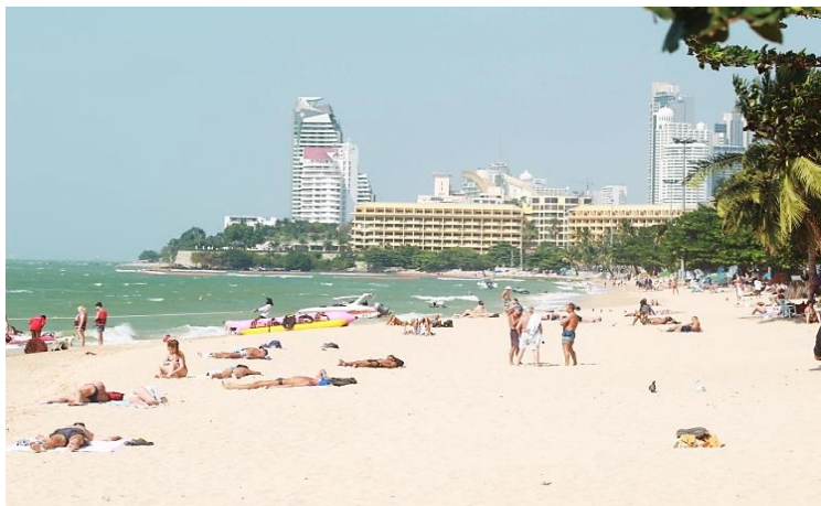
ภาพ นักท่องเที่ยวที่เดินทางมาอาบแดดที่ชายหาดพัทยา

สำหรับนักท่องเที่ยวกลุ่มนี้หนาวที่ เป็นผู้สูงอายุนี้ จะมีความต้องการในด้านการบริการที่สะดวกสบาย บริการทางการแพทย์ ความปลอดภัย และความเป็นมิตรของประเทศที่ไปเยี่ยมเยือน โดยมุ่งความสนใจไปที่ สภาพภูมิอากาศ สุขภาพ และรูปแบบการใช้ชีวิต