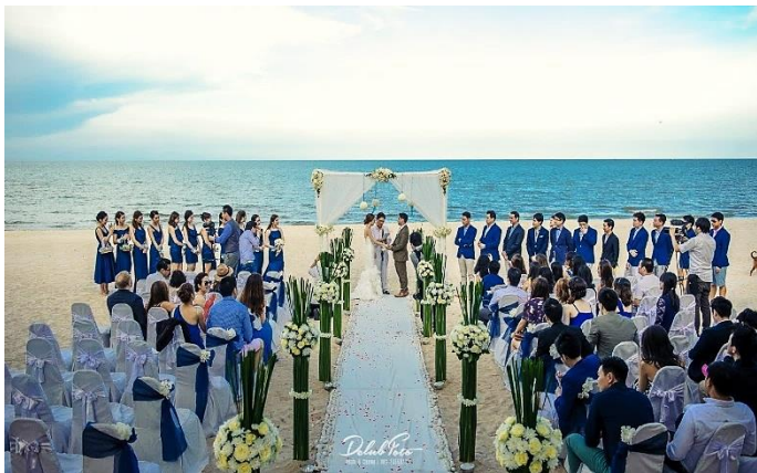
ภาพ การจัดงานแต่งงานริมชายหาด

กลุ่มพิเศษอีกกลุ่มหนึ่งที่กำลังเติบโตและน่าจับตามองอย่างยิ่ง ส่วนในด้านบริการท่องเที่ยวก็เป็นไปตามสิ่งที่นักท่องเที่ยวร้องขอ ไม่ว่าจะเป็นแนวการจัดงานหรือธีมงาน (Theme) การออกแบบ จัดตกแต่งสถานที่ พิธีกรรมต่างๆ หรือในทางกลับกันคู่แต่งงานบางคู่ต้องการให้จัดพิธีการตามแบบอย่างของประเทศนั้นๆ เช่น ชาวต่างชาติขอจัดงานแต่งงานเป็นพิธีแบบไทยๆ