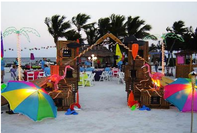
ภาพ การจัดปาร์ตี้ริมหาด (Party Beach)

การท่องเที่ยวเพื่อความสำราญอาจอยู่ในรูปแบบที่ผิดกฎหมาย เช่น การใช้หญิงบริการ โดยเฉพาะในแถบเอเชีย ความแตกต่างของการเที่ยวผู้หญิงบริการกับการมีความสัมพันธ์กับคนแปลกหน้า คืออย่างแรกเป็นการค้า และหญิงบริการเหล่านั้นอาจไม่เต็มใจทำงานหรือมีความสัมพันธ์กับนักท่องเที่ยว นักท่องเที่ยวในกลุ่มแรกนี้โดยมากเป็นเพศชายและมีอายุมากกว่านักท่องเที่ยวในกลุ่ม 4Ss ซึ่งอาจเป็นนักท่องเที่ยวจากชาติใดก็ได้ แต่ที่เห็นมากจะเป็นนักท่องเที่ยวชาวญี่ปุ่นและกลุ่มที่มาจากยุโรปตอนเหนือ อย่างไรก็ตามในบางประเทศ เช่น ออสเตรเลีย และสวีเดน มีกฎหมายห้ามประชาชนมีพฤติกรรมการท่องเที่ยวเพื่อบริการทางเพศ ดังนั้นการท่องเที่ยวไทยก็ควรตระหนักถึงความไม่ถูกต้องเหมาะสมสำหรับการท่องเที่ยวรูปแบบดังกล่าวนี้ และหันมาปรับพฤติกรรมนักท่องเที่ยวเหล่านั้น โดยสร้างสินค้าทางการท่องเที่ยวอื่นขึ้นมาทดแทน เช่น การจัดปาร์ตี้ริมหาด การจัดเทศกาลดนตรี ฯลฯ