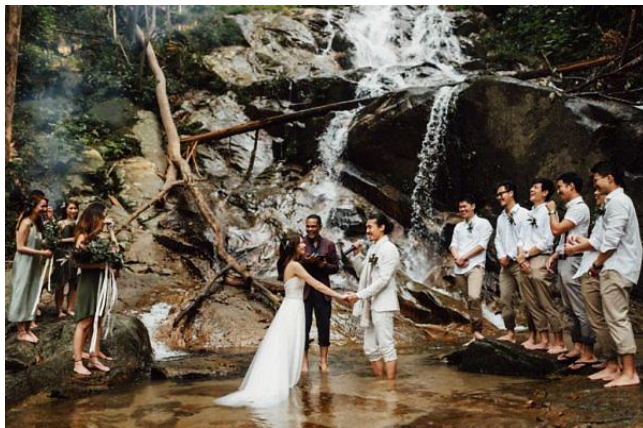
ภาพ การจัดงานแต่งงานในป่า