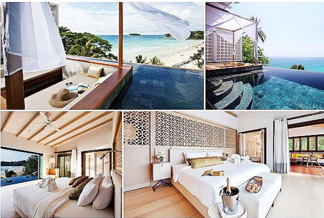
ภาพ ห้องพักที่มีการจัดตกแต่งพิเศษแบบฮันนีมูน (Honeymoon)

นักท่องเที่ยวกลุ่มฮันนีมูน (Honeymooner Tourists) เป็นกลุ่มนักท่องเที่ยวที่มีความต้องการพิเศษในหลายๆ ด้าน ไม่ว่าจะเป็นด้านที่พัก ลักษณะของห้องพัก การตกแต่งห้องพัก อาหารและเครื่องดื่ม ที่อาจร้องขอของมีอาหารค่ำแบบโรแมนติก และกิจกรรมการท่องเที่ยวในระหว่างคืนน้ำผึ้งพระจันทร์ ซึ่งนักท่องเที่ยวกลุ่มนี้จะเป็นกลุ่มที่ยอมจ่ายเงินเพื่อความสะดวกพิเศษดังกล่าว ดังนั้นจึงจัดเป็นนักท่องเที่ยวกลุ่มพิเศษกลุ่มหนึ่งที่ต้องการการบริการที่ไม่เหมือนใคร คือต้องการความแตกต่าง ความเป็นคนพิเศษ ความเป็นส่วนตัว การจัดบริการท่องเที่ยวต้องเป็นไปตามที่ร้องขอ ซึ่งธุรกิจท่องเที่ยวจะต้องให้ความสำคัญกับบริการพิเศษดังกล่าวนี้ เช่น การจัดห้องพักในวิวสวยงาม หอระพี โรแมนติก อาจโรยดอกไม้ บนเตียงนอนหรือพับผ้าเช็ดตัวเป็นรูปหงส์คู่ มีไวน์ (Wine) หรือแชมเปญ (Champagne) ไว้ในห้องพัก การจัดกิจกรรมรับประทานอาหารค่ำบนเรือล่องไปตามแม่น้ำยามค่ำคืน ฯลฯ