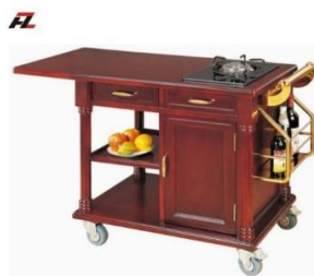
ภาพที่ 1. รถเข็น gueridon

1.4 โต๊ะเข็นสำหรับบริการลูกค้า (service table or gueridon) โต๊ะสำหรับบริการลูกค้า อาจมีล้อหรือไม่มีก็ได้ขนาดโดยทั่วไปมีความกว้างประมาณ 50 เซนติเมตร ความยาวประมาณ 80 เซนติเมตร โต๊ะบริการนี้ควรมีชั้นวาง 2 ชั้นเพื่อวางเครื่องมือ เครื่องใช้ที่จำเป็นด้านข้างหรือด้านหัวโต๊ะอาจกางปีกออกได้เพื่อใช้เนื้อที่ให้คุ้มค่า