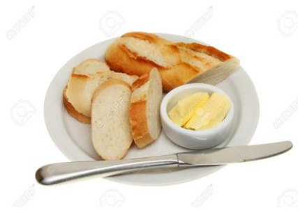
ภาพที่ 2. Bread and butter plate

3.1 bread and butter plate เส้นผ่านศูนย์กลาง 5 – 6 นิ้ว นอกจากใช้ใส่ขนมปังแล้วยังสามารถใช้เป็นจานรองสำหรับแยม เนยที่อยู่ในกล่อง กระปุกน้ำตาล เครื่องปรุงอื่น ๆ รวมถึงอ่างล้างมือ (finger bowl) หากบางห้องอาหารไม่มีแฟ้ม (folder) สำหรับใส่บิลให้แขก อาจนำบิลนั้นวางมาบน bread plate ก็ได้