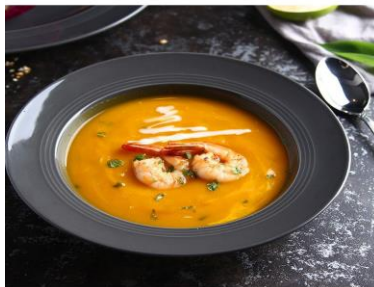
ภาพที่ 3. Soup plate

3.3 Soup plate ขนาดเส้นผ่านศูนย์กลาง 8 – 10 นิ้ว ใช้สำหรับใส่ซุ๊ป สตูหอยนางรม หอยทาก และอาหารอิตาเลียน