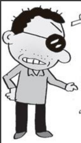
เจ้าหนี้